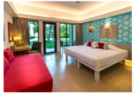
BEACH/GARDEN CLUB ROOM