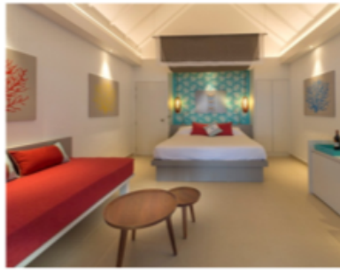
BEACH DELUXE ROOM with Terrace